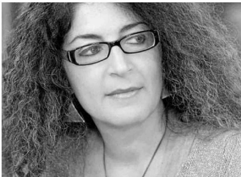
La escritora italiana Melania G. Mazzucco (Roma, 1966).

Evidentemente, la soldado italiana que resulta herida en un atentado en Afganistán y vuelve a su pueblo a pocos kilómetros de Roma es un personaje de ficción. Su pelotón y su base tampoco existen. Pero no es de extrañar